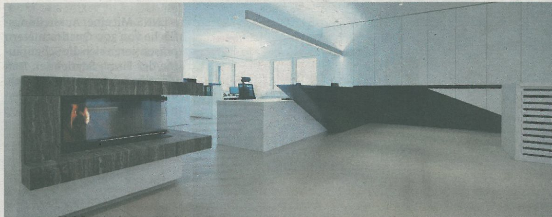
Der Schauraum der Firma Seyrlehner wurde offener und moderner gestaltet.

■ ENNS. Die Modernisierungsarbeiten der Firma Seyrlehner sind abgeschlossen. Mit einer Ausstellungsfläche von 300 Quadratmetern erstrahlen die Schauräume in neuem Glanz. Nach einem Komplettumbau findet man auf 200 Quadratmetern jetzt auch einen erweiterten Fliesenschauraum mit integriertem Holz- und Pelletofen-Studio von „Kamin&Ofen“. Zum Neubau kam es wegen Platzmangels, wie Geschäfts-