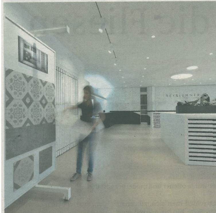
Die neuen Schauräume der Firma Seyrlehner bieten nicht nur mehr Platz, sondern überzeugen mit Eleganz.

Das neue Gebäude der Firma Seyrlehner Enns bietet ihren Produkten nun ausreichend Platz.